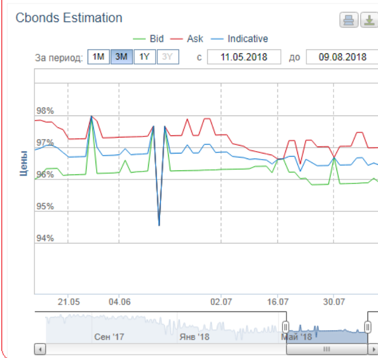
График архивных значений торгов облигациями